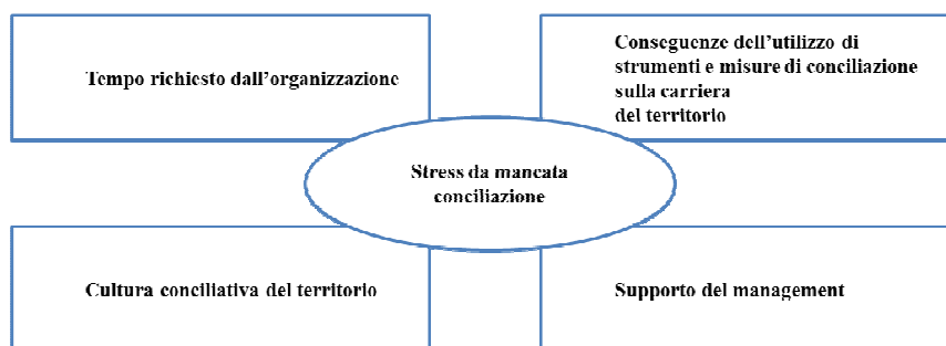
Fig. 1 Il framework teorico della ricerca

La ricerca intende comprendere le relazioni tra le quattro dimensioni (il «tempo richiesto dall’organizzazione»; le «conseguenze dell’utilizzo di strumenti e misure di conciliazione sulla carriera del territorio», il «supporto del management» e la «cultura conciliativa del territorio») individuate dalla letteratura a cui si è fatto riferimento sopra e ricomprese nel framework teorico e tra queste quattro e la percezione di «stress da mancata conciliazione».