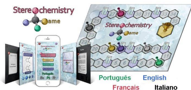
Figura 1 - La App HSG400 è disponibile in quattro lingue.

Hybrid Stereochemistry Game (HSG400) (Silva Jr. et al. 2021) è una App disponibile per Android e per iOS e scaricabile gratuitamente da Play Store e Apple Store. E' disponibile in quattro lingue, tra cui l'italiano (Figura 1).