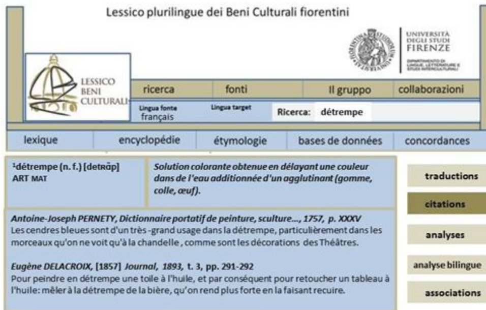
Image 2 : article monolingue français « 1. détrempe », informations de bases et citations

Nous proposons cependant aussi des informations facultatives, qui sont de différents types selon les langues (par exemple dans la catégorie « analyses » peuvent apparaître tant des informations étymologiques qu'encyclopédiques ou historiques) et/ou selon les types de mots ou syntagmes décrits.