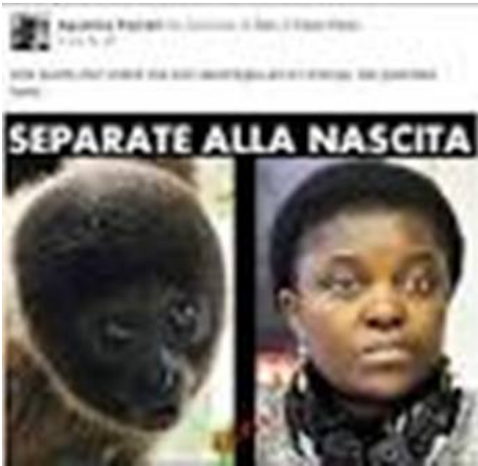
7- Photomontage signé Roberto Calderoli.