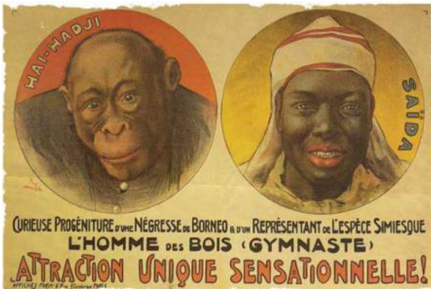
3- Affiche de 1931 invitant à visiter un “zoo humain” au Jardin d’acclimatation de Paris.