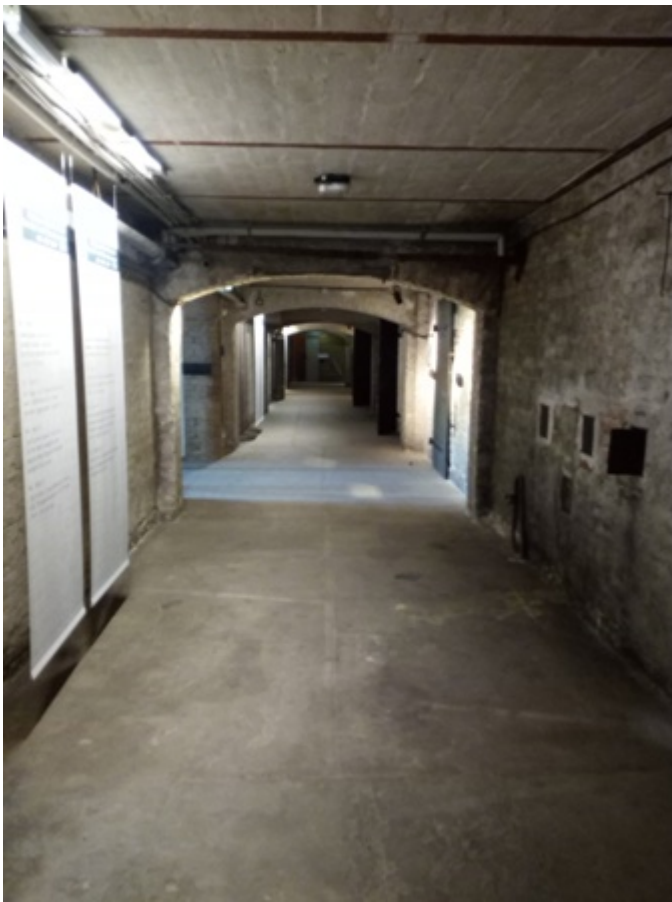
Fig. 12 Papenstrasse

Dunque, se uscendo dalla futuristica Hauptbahnhof berlinese sulla destra