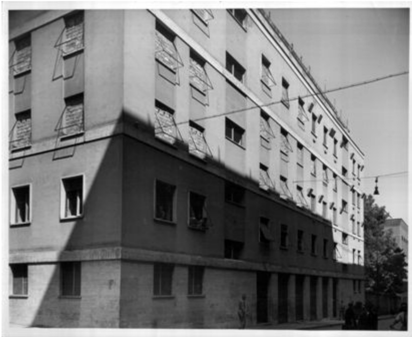
Fig. 13 Via Tasso