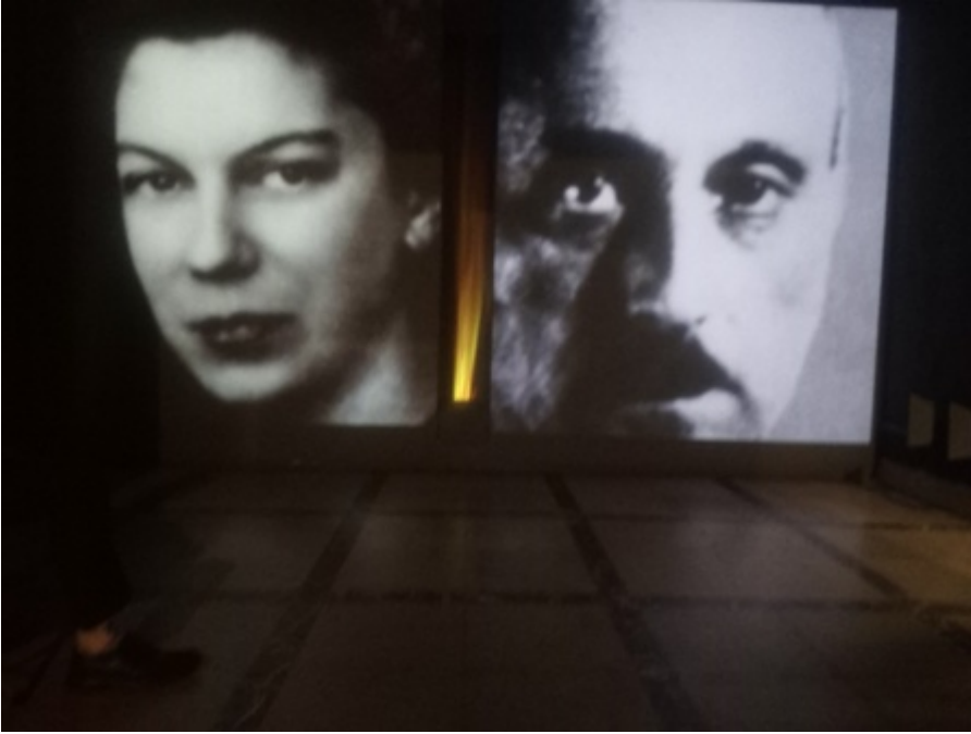
Fig. 4 Viale Szuch. Per le foto di viale Szuch, ringrazio il direttore del Museo, prof. Tadeusz Skoczek e il dott. Andrzej Kotecki

attive cinque installazioni video, fra cui il già citato Volontà di sopravvivere , e l'impressionante Segnali di accerchiamento . All'altezza delle finestre del seminterrato è proiettato un video che mostra il passaggio di stivali militari, accompagnato dal battito dei tacchi ferrati che accompagna senza pause il visitatore.