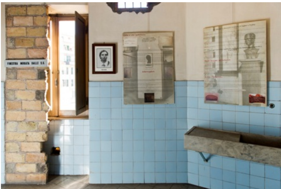
Fig. 14 Via Tasso, la cella di Montezemolo

Le pareti hanno conservato quasi inalterato un patrimonio unico di graffiti e iscrizioni (vi ha dedicato un libro Stanislao G. Pugliese della Hofstra University: Desperate Inscriptions: Graffiti from the Nazi Prison of Rome, 1943-1944 ). Fra ristrettezze economiche quasi grottesche (sempre sul punto di chiudere per mancanza di fondi - e opposizioni politiche -, il Museo non è neanche stato in grado di acquisire i piani superiori della