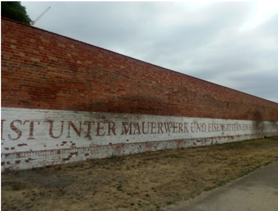
Fig. 7 Il Parco di Moabit