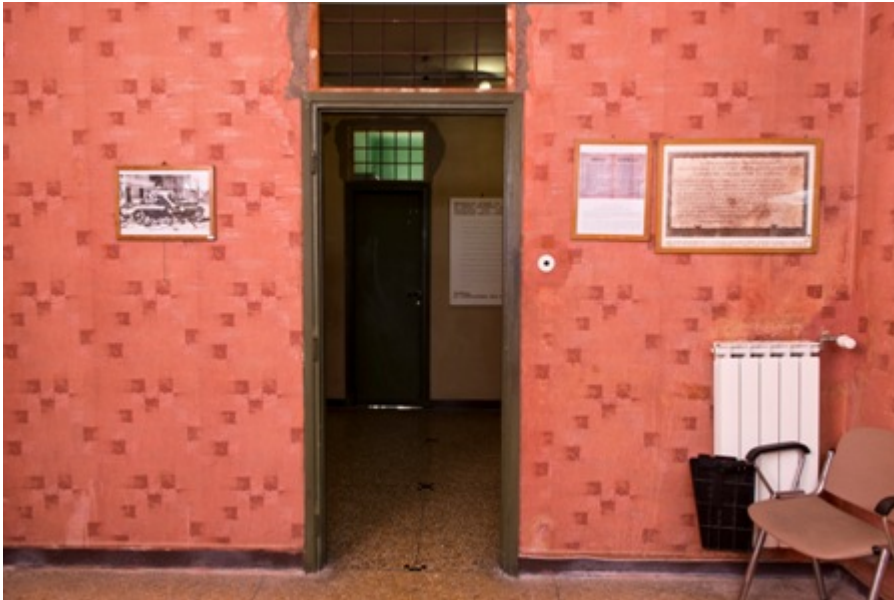
Fig. 16. Via Tasso