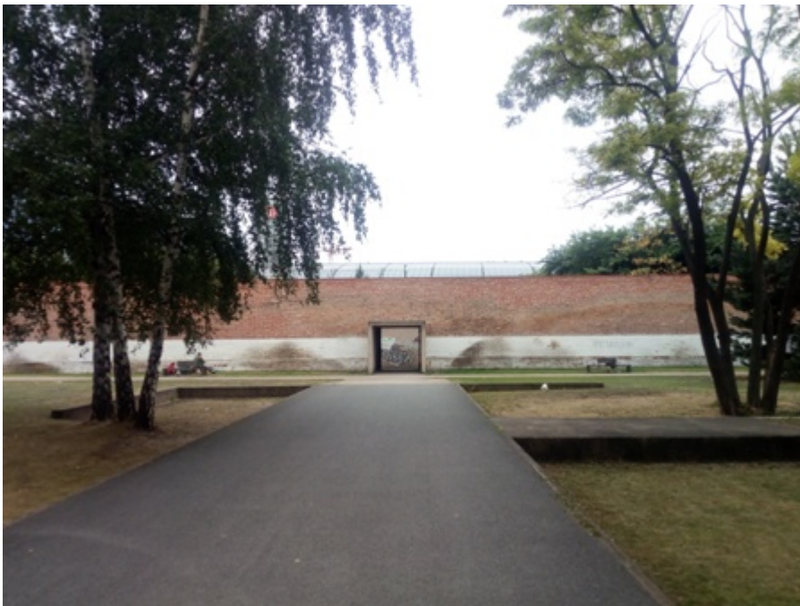
Fig. 10 Il Parco di Moabit