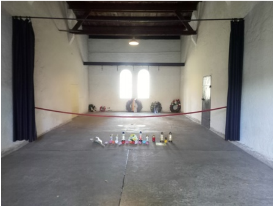
Fig. 11 Plotzensee