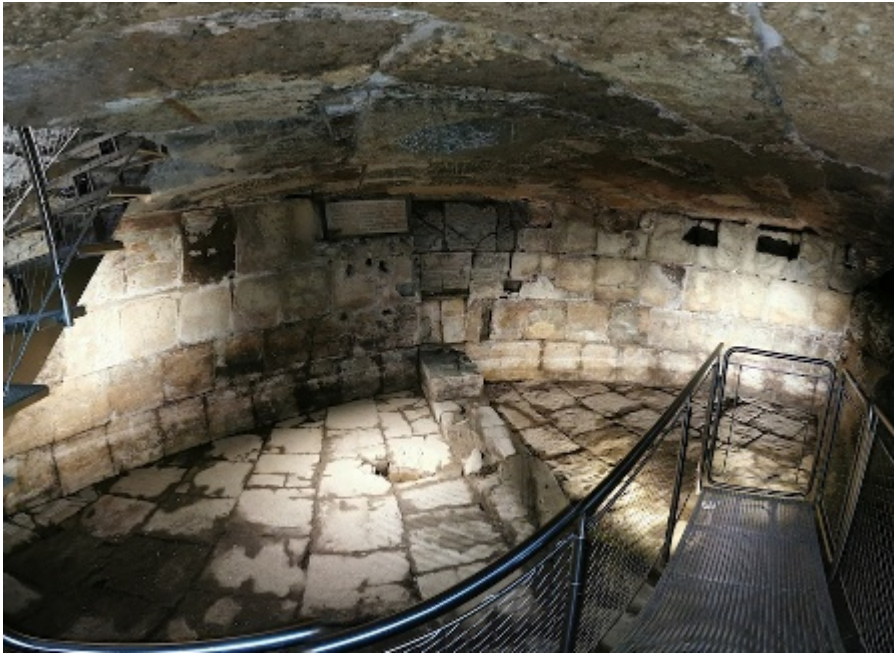
Fig. 18. Carcere Mamertino. Il Tullianum livello inferiore