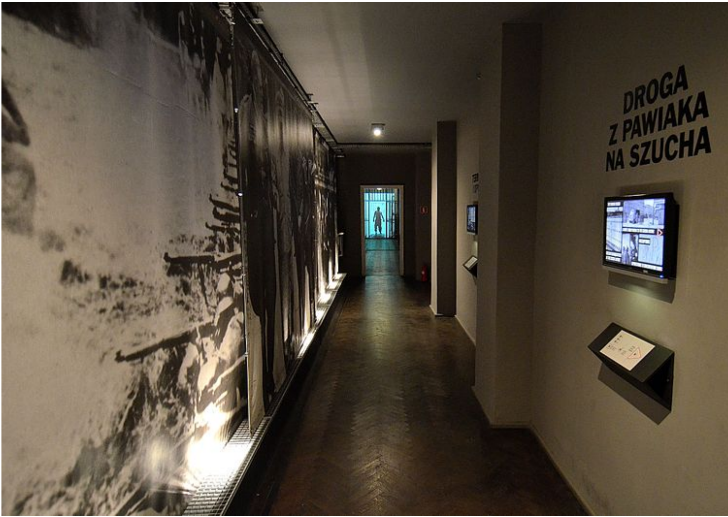
Fig. 5 Viale Szuch