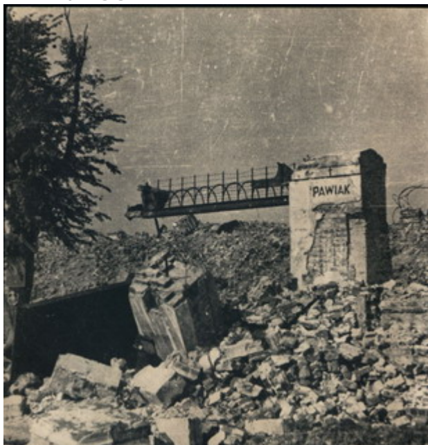
Fig. 1 Le rovine del Pawiak.

celebrazioni religiose, marce di ex detenuti e deportati. Le foto dell'immediato dopoguerra mostrano cortei di persone afflitte, spesso con le divise e le insegne dei campi di concentramento, che avanzano su un mare indistinto di rovine (il Pawiak è collocato nel centro della città, all'interno della vasta zona del ghetto ebraico, raso al suolo dai nazisti nel maggio 1943). Il Museo è stato inaugurato nel 1964. Il piazzale esterno è marcato da una delle pochissime rimanenze materiali dell'antico edificio: un frammento del muro di cinta che delimitava l'ingresso, a cui è rimasto appeso un lungo braccio di ferro ricoperto da filo spinato che, dall'altro lato, poggia sul nulla.