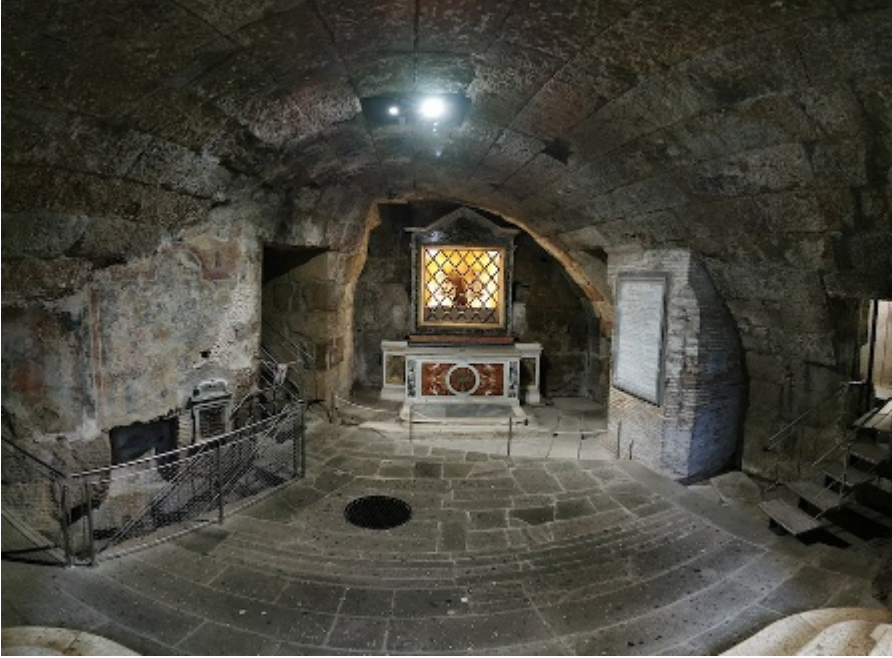
Fig. 17. Carcere Mamertino, livello intermedio con l'altare di Pietro e Paolo. Per le immagini del Carcere Mamertino ringrazio sentitamente il dott. Carlo Munns.

dobbiamo la salvezza del luogo, che nel 314 smise di essere un carcere e fu trasformato in chiesa, san Pietro in Carcere. Affacciandoci sul perimetro della fossa profonda in cui giacevano i condannati vediamo ancora, sul fondo, scorrervi dell'acqua. I detenuti «vi venivano abbandonati alle potenze degli inferi, risucchiati dalla terra e come tali cancellati dall'esistenza» (Patrizia Fortini, citata in G. SILVESTRI 2010).