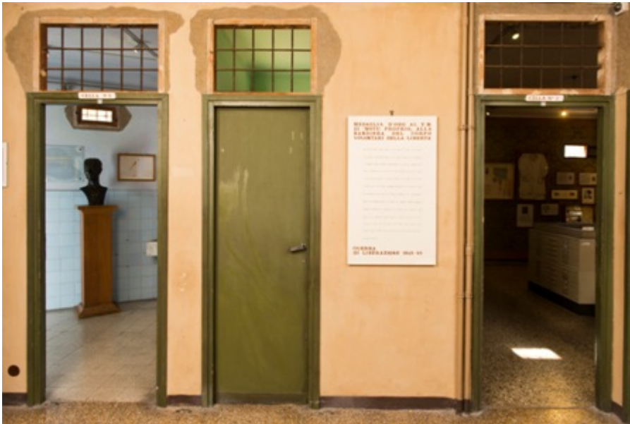
Fig. 15. Via Tasso

fumaria, un lavello in marmo; le finestre murate riproducono le grandi aperture regolari che si aprivano sul lato interno dell'edificio, a cui ci si poteva appoggiare, innaffiare gerani, appendere la biancheria. È una sorta di evoluzione al suo massimo grado delle vicende ottocentesche dei bambini terribili di Pierino Porcospino ovvero Struwwelpeter, dove la rispettabilità borghese mostra, senza veli, la sua propensione al male, alla violenza, alla vendetta priva di causa prima (su questo tema cfr. ad es. HANDLER SPITZ 2001: 45 sgg).