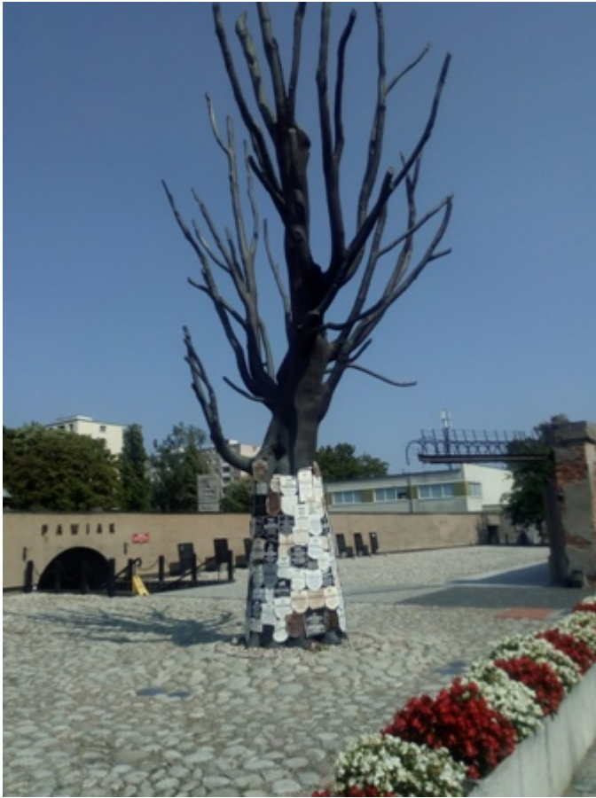
Fig. 3 L'olmo del Pawiak oggi.

La costruzione del memoriale, rimarcano le guide al luogo (come STAWARZ 2011, GIERCZYŃSKA 2016), ebbe inizio a seguito di un'iniziativa popolare dei cittadini e degli ex detenuti. Benché sia facile immaginare che una parte preponderante della popolazione di Varsavia condividesse questo desiderio, è comunque almeno altrettanto difficile figurare un movimento spontaneo in una società dalle molte caratteristiche totalitarie, come quella polacca del periodo. Qualsiasi movimento "spontaneo" in grado di portare a fondamentali decisioni topografiche e politiche come quella di cui stiamo parlando non poteva non partire, o non essere appoggiato, dalla nomenklatura statale e governativa; un dato di fatto questo che non può non essere noto agli estensori delle note storiche sul Pawiak; il menzionare però il carattere popolare e spontaneo di questa iniziativa confluisce armonicamente nella descrizione dell'anima