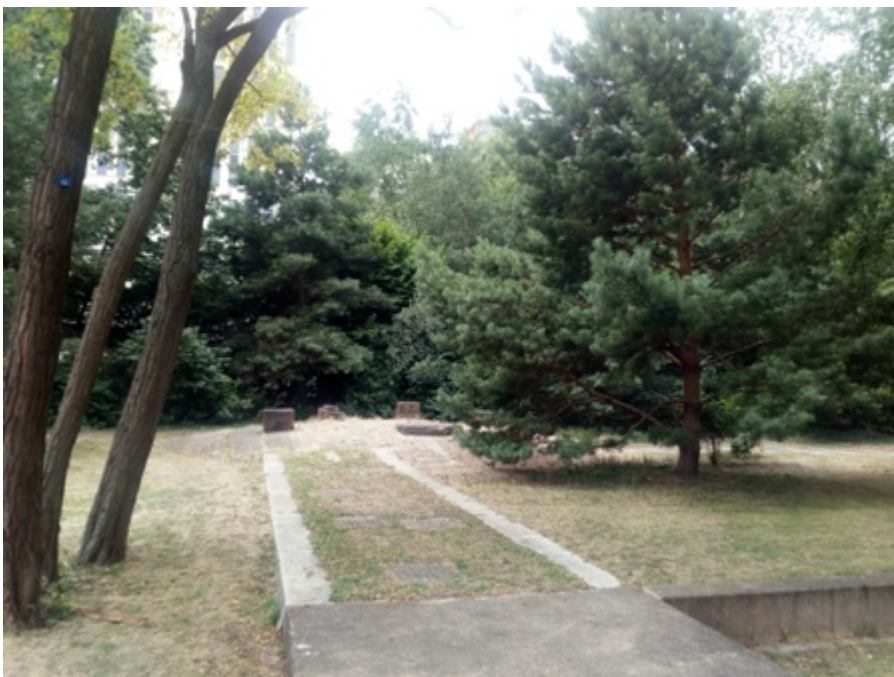
Fig. 8 Il Parco di Moabit