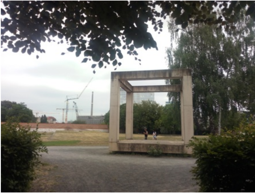
Fig. 9 Il Parco di Moabit