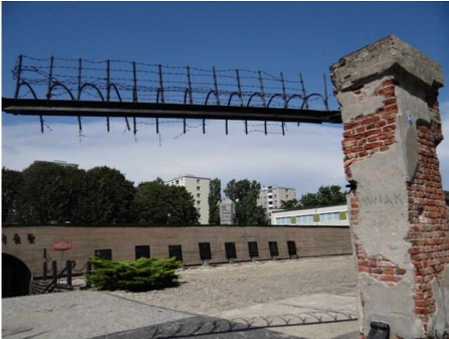
Fig. 2 L'ingresso al Pawiak

Nelle prime foto (vedi le immagini contenute nel volume di Gierczyńska all'indirizzo Disponibile online ) possiamo distinguere anche un olmo il cui tronco, già dal 1945, cominciò a ricoprirsi di targhe commemorative con i nomi degli assassinati nel Pawiak e di cui non esisteva luogo di sepoltura. L'albero, che potrebbe definirsi un peculiare esempio di Land Art , insieme al frammento del cancello di ingresso è il simbolo più caratteristico della struttura; un'intera sala nell'esposizione stabile ne documenta la vita (morì a metà degli anni Ottanta), la semi esistenza in una sorta di limbo (tagliato e imbevuto, era stato conservato fino al 2004), e quindi la resurrezione in altra sostanza (nel 2004 ne venne fusa una copia esatta in bronzo, inaugurata solennemente l'anno successivo).