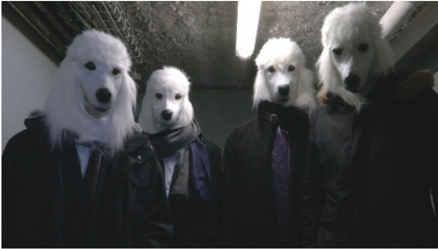
Fig. 2 Chimère , photographie, 2016, Image fournie par Emmanuelle Pireyre.