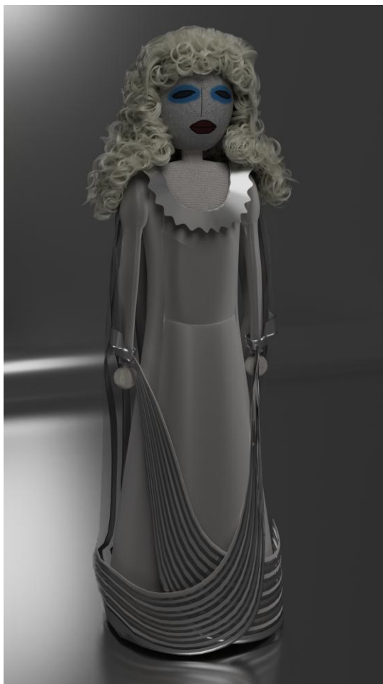
Figura 6 - Alessia Musa (Mdvsa), La regina della neve , modello 3D, 2024.