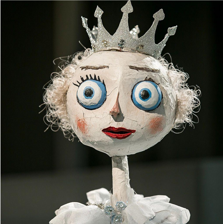
Figura 5 - Alessandra Bergamaschi, La regina della neve , immagine generata artificialmente, 2024.

parte dell'AI, offrendo al contempo nuove prospettive estetiche come fonte di ispirazione per futuri allestimenti.