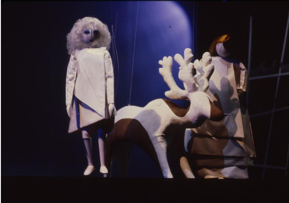
Figura 3 - Gianni Renna, La regina della neve: Gerda in Finlandia , fotografia, 1982.

Fonte: APICE – Università degli Studi di Milano, Archivio Teatro Colla, 4. Fotografie e diapositive, 17. La regina della neve , Diapositive, negativi e stampe dell'allestimento 1982, 17. La regina della neve: Gerda in Finlandia -43-.